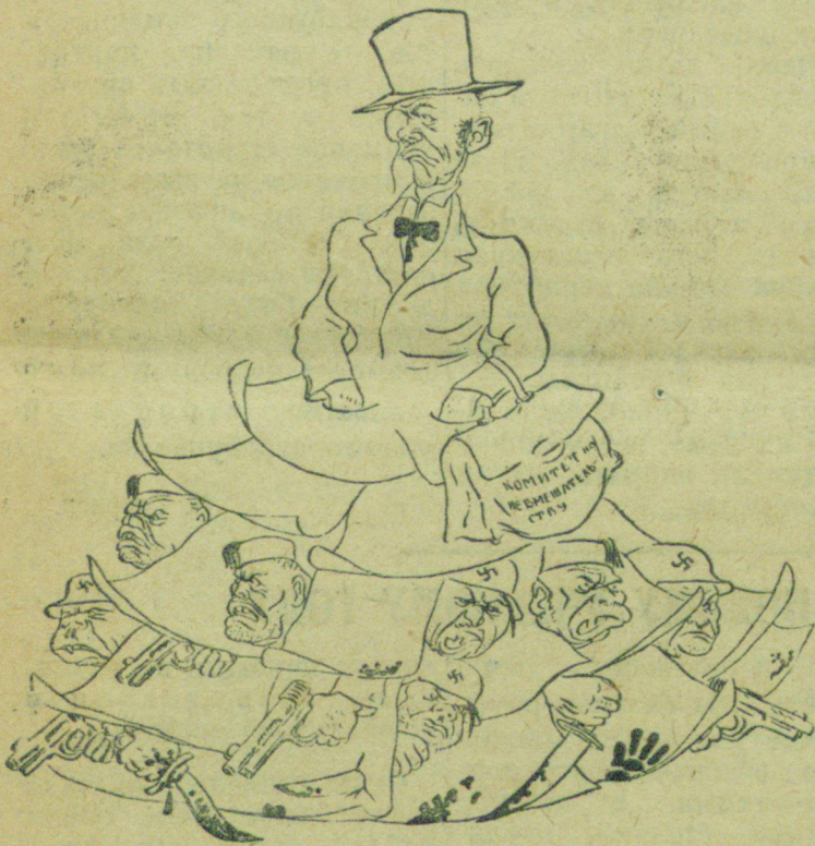
„Комитет по невмешательству“