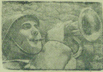
На снимке: Горнист республиканской армии.