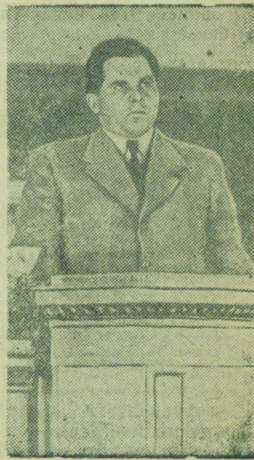
На снимке: Нарком финансов СССР А. Г. Зверев выступает с докладом.