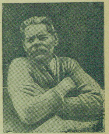
Приезд А. М. Горького в СССР в 1928 году.

— Вот он, город-то. Приехали! Ну, куда пристать?