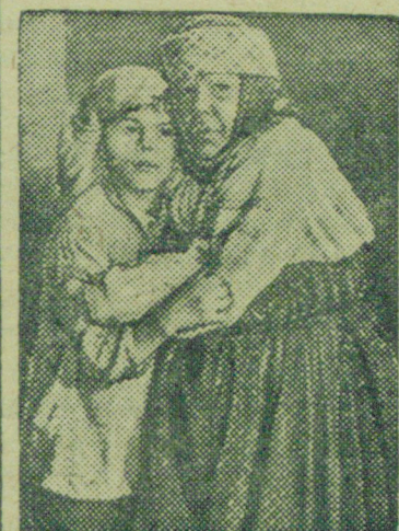
Студия „Союздетфильм“ выпустила новый кинофильм „Детство Горького“.

Подул легкий ветерок... река покрылась тонкой, частой рябью, и мягкий шум деревьев широкой волной пролился в воздухе, влажном и свежем.