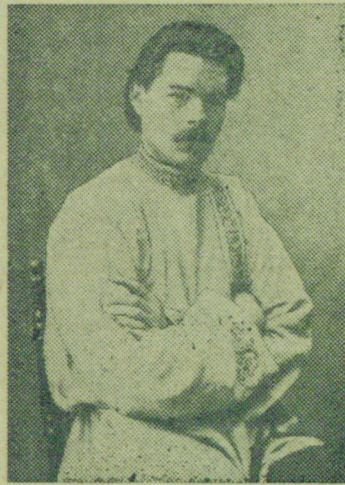
А. М. Горький (1900 г.).

Барин смотрел—я едкое чувство обиды и желания возмездия наполняло его. Он пожалел, что с ним нет ничего, ни палки, ни ре-