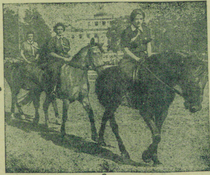
На снимке: Кавалеристы Конно-Спортивного клуба Осоавиахима на Масляном лугу (Центр. Парк Культуры и Отдыха им. С. М. Кирова в Ленинграде).

Лучшая часть молодежи капиталистических стран сознает, что единственным выходом из ее беспросветного положения, из кошмара фашистского мракобесия является революционная борьба. Эта борьба началась, и она будет доведена до конца. Ничто не спасет фашизм. Этот заклятый враг молодежи и всего прогрессивного человечества будет уничтожен.