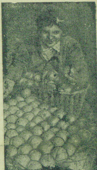
Колхоз „Зряковская Гора“ (Карамышевский район) получил большой урожай яблок.

Техник по безопасности горных выработок Буйлин.