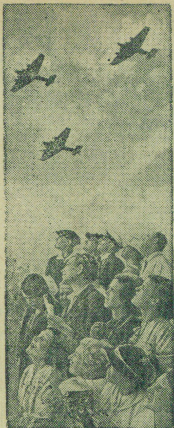
НА ПРАЗДНИКЕ СОВЕТСКОЙ АВИАЦИИ