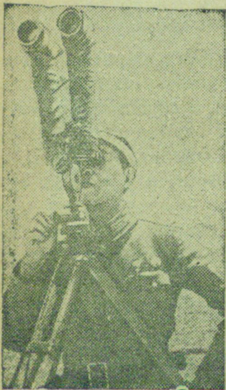
На сн.: Боец артиллерии китайской армии наблюдает за действиями противника.