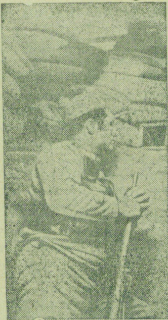
На сн.: Боец республиканской армии наблюдает из окопа за действиями противника (фронт Эбро).