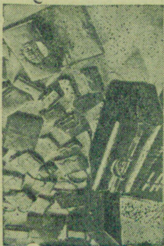
Ленинградская фабрика по обработке кожи им. Бебеля готовит ряд экспонатов на всемирную Нью-Йоркскую выставку. На сн.: готовые экспонаты для выставки.

Администрация ЦММ должна эти недостатки устранить и по-настоящему возглавить стахановское движение молодежи. Коневский.