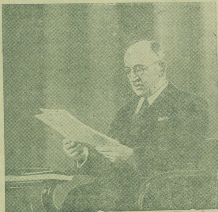
На сп.: Быв. президент Чехословацкой республики Бенеш обращается по радио с речью ко всем народам Чехословакии.

Созданная согласно мюнхенских решений, так называемая международная комиссия, действуя в духе гитлеровских требований, выделила ряд новых районов Чехословакии, которые должны быть переданы Германии. Эти районы включены в „пятую зону“, подлежащую германской оккупации. Сюда входят пункты, имеющие крупное экономическое и военно-стратегическое значение. Германии передается район Цноймо, где расположены крупные каолиновые копи, район Поличка с круп-