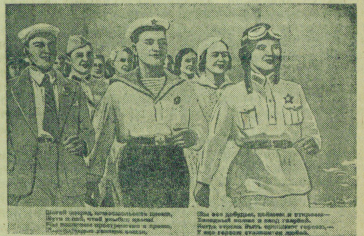
На снимке: Плакат работы художника Мельниковой, выпущенный издательством „Искусство“ (текст песни — поэта орденоносца В. Лебедева-Кумача).