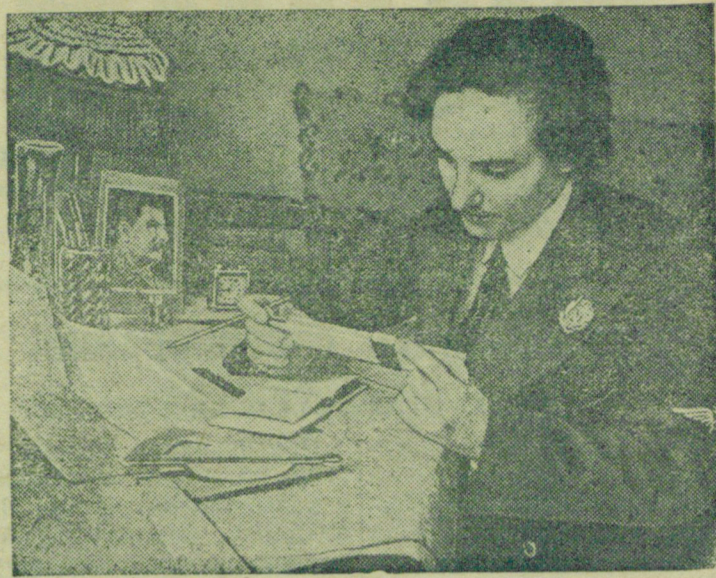
На сн.: депутат Верховного Совета СССР командир самолета „Родина“ летчик орденосеца Валентина Степановна Гризодубова за работой у себя в кабинете.