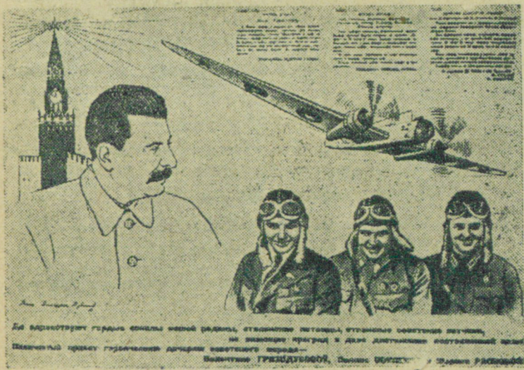
Плакат работы художников Дени, Долгорукова и Дужанова выпущенный издательством „Искусство“ к приезду в Москву героического экипажа „Родина“.

Между тем, если сейчас не принять решительные меры к обеспечению монтажных работ оборудованием, если сейчас же центрально-механическая мастерская не приступит к работе топливopодачи и золоудаления, на ЦЭС может создаться серьезное положение, ибо старая котельная не обеспечивает нормальную работу турбин. Без пуска новой котельной в эксплуатацию в ближайшие один два месяца, первый и второй рудник не могут быть обеспечены электроэнергией в той мере, которая потребуется для пуска рудников. Это допустить нельзя. Следовательно необходимо сейчас принять серьезные и решительные меры к тому, чтобы новую котельную пустить в эксплуатацию не позже 1 января 1939 г. Тайгин.