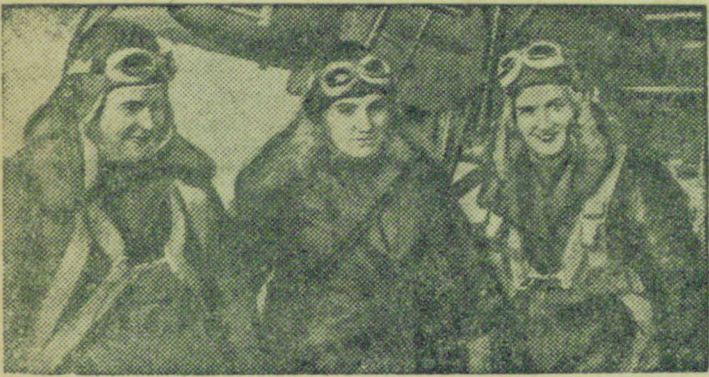
На снимке (слева направо): П-й пилот самолета „Родина“ капитан-орденоносец П. Д. Осипенко, командир экипажа, депутат Верховного Совета СССР, орденосец В. С. Гризодубова и штурман самолета, старший лейтенант-орденоносец М. М. Раскова у самолета „Родина“.

Всем отмеченным в Указе товарищам будет выдана денежная награда в размере их двухмесячного оклада. (ТАСС).