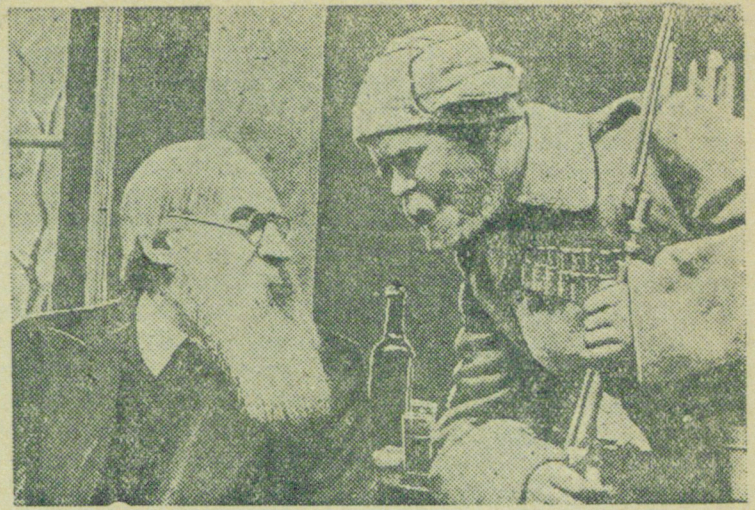
К 47-летию Московского ордена Ленина Художественного академического театра им. А. М. Горького.

СОБСТВЕННЫЕ АВТОМОБИЛИ имеют сотни рабочих, служащих и специалистов московских предприятий. На одном лишь автозаводе имени Сталина около 240 рабочих—стахановцев, инженеров и техников являются владельцами автомашин. (ТАСС).