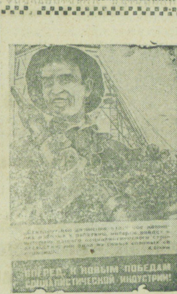
На сн. новый плакат, выпущенный издательством "Искусство" (работы художника В. Елкина).