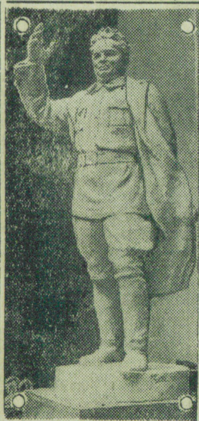
С. М. КИРОВ.