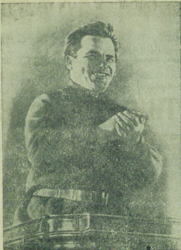
Выступление С. М. Кирова на 17 партс'езде.

УСПЕХИ ДЕЙСТВИТЕЛЬНО У НАС ГРОМАДНЫ. ЧОРТ ЕГО ЗНАЕТ, ЕСЛИ ПО-ЧЕЛОВЕЧЕСКИ СКАЗАТЬ, ТАК ХОЧЕТСЯ ЖИТЬ И ЖИТЬ.