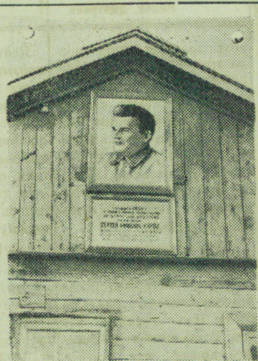
КИРОВСК. На снимке домик, в котором происходило историческое совещание, где Сергей Миронович КИРОВ положил начало развитию промышленности, строительству города, ныне носящего его великое имя.