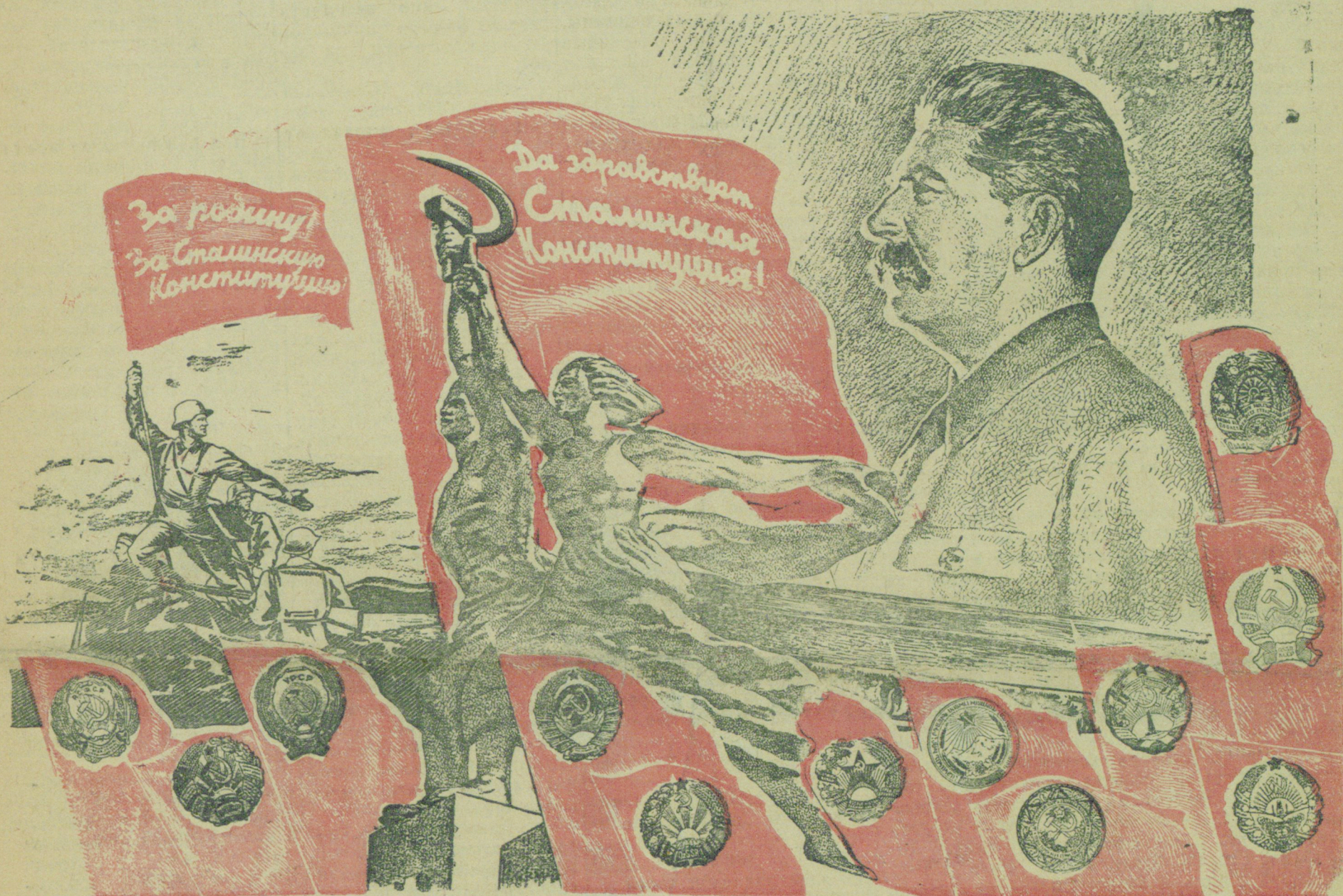
Рисунок худ. Шера „Союзрето“.

ПЯТОЕ декабря — всенародный праздник трудящихся СССР.