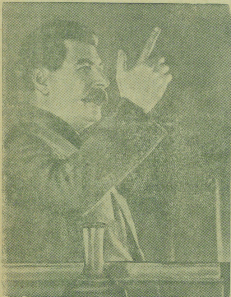
На снимке: И. В. Сталин на VIII Чрезвычайном Всесоюзном съезде Советов (1936 г.).

Перейдем, наконец, к вопросу об интеллигенции, к вопросу об инженерно-технических работниках, о рабочих культурного фронта, о служащих вообще и т. п. Она также претерпела большие изменения за истекший период. Это уже не та старая заскорузлая интеллигенция, которая пыталась ставить себя над классами, а на самом деле служила в своей массе помещикам и капиталистам. Наша советская интеллигенция, это — совершенно новая интеллигенция, связанная всеми корнями с рабочим классом и крестьянством. Изменился, во-первых, состав интеллигенции. Выходцы из дворянства и буржуазии составляют небольшой процент нашей советской интеллигенции. 80—90 процентов советской интеллигенции — это выходцы из рабочего класса, крестьянства и других слоев трудящихся. Изменился, наконец, и самый характер деятельности интеллигенции. Раньше она должна была служить богатым классам, ибо у нее не было другого выхода. Теперь она должна служить народу, ибо не стало больше эксплуататорских классов. И именно поэтому она является теперь равноправным членом советского общества, где она вместе с рабочими и крестьянами, в одной упряжке с ними ведет стройку нового бесклассового социалистического общества.