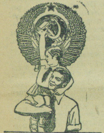
Согреты Сталинским солнцем. Идем мы, отвагой полны. Дорогу веселым питомцам Великой советской страны!