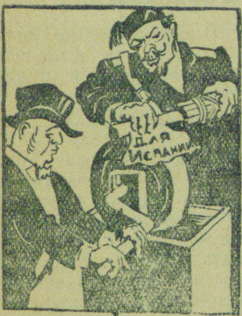
Подготовка к Англо-Итальянскому соглашению. Рис. Б. Анфилова. (Прессклише).

дат и ранеными двух офицеров и 685 солдат. За это время китайцы захватили в селе трех японских офицеров и 79 солдат. (ТАСС).