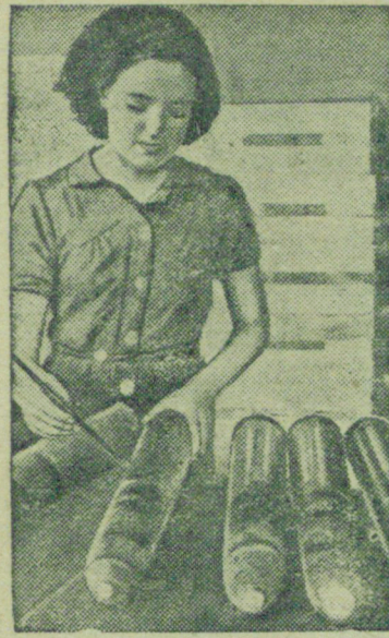
Женщины республиканской Испании работают на предприятиях оборонной промышленности вместо мужчин, ушедших на фронт.