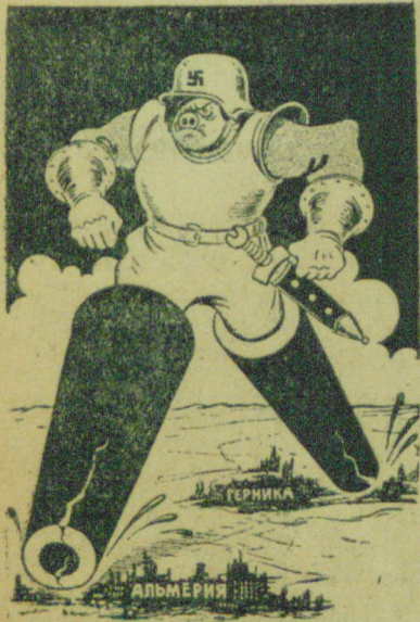
Кровавые „шаги фашизма“

Только в нашей счастливой стране победившего социализма нет и не может быть безработицы. Сталинская Конституция гарантирует всем гражданам СССР право на радостный труд.