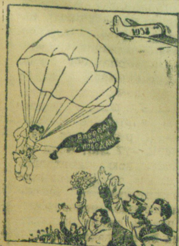
С новым годом, с новыми успехами! Рисунок Ю. Дмитриева и Г. Вальк. Бюро-клубе ТАСС.

Стахановец шахты им. С. М. Кирова Чайкин