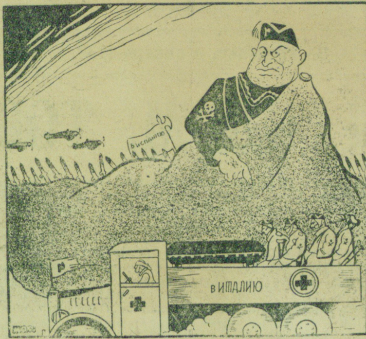
— Я ежедневно эвакуирую сотни добровольцев, не понимаю, что еще нужно?

1938 год прошел в капиталистическом мире под знаком кровавых захватнических войн, под знаком широкого развивающегося нового мирового экономического кризиса. Стало особенно ясно, что „государства и народы как-то незаметно вползли в орбиту второй империалистической войны. Начали войну в разных концах мира три агрессивных государства