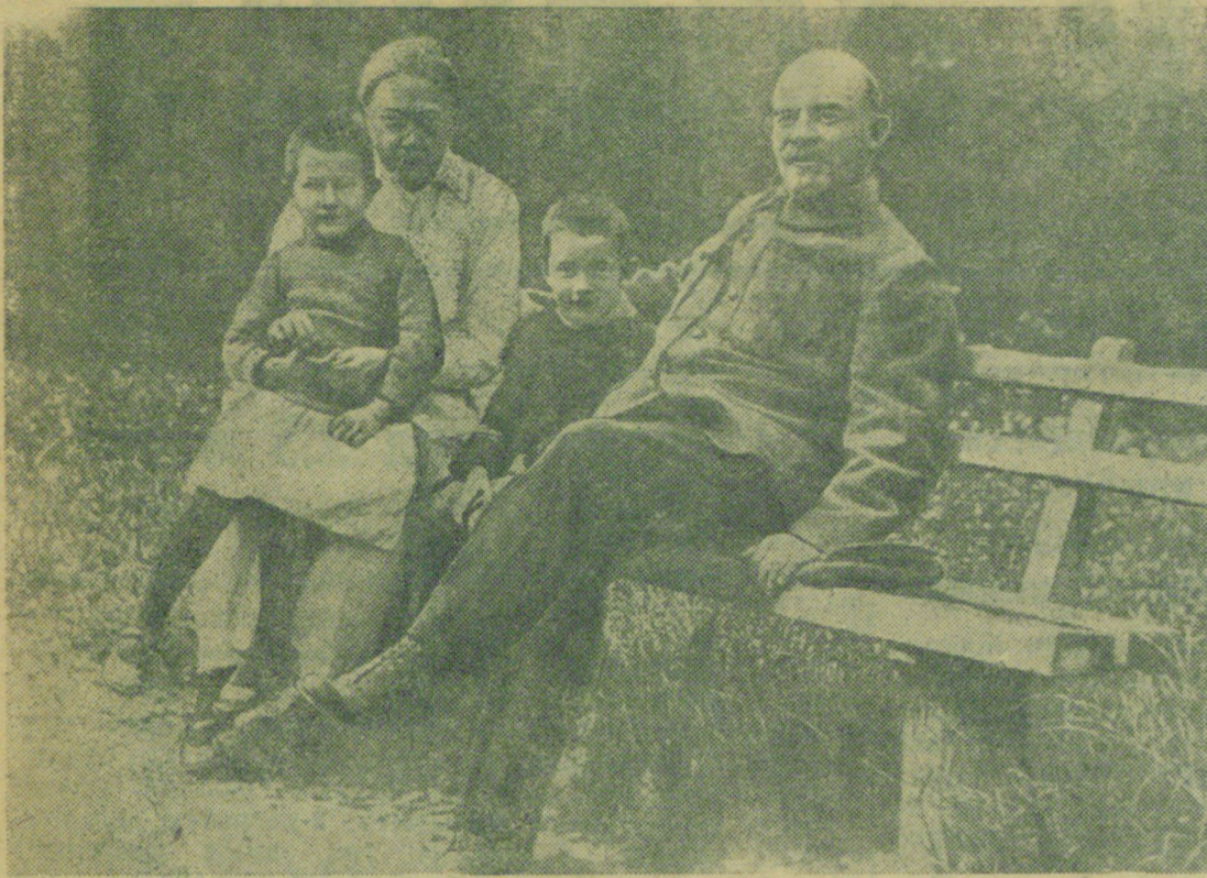
В. И. Ленин и Н. К. Крупская с племянником Витей и дочерью рабочего Верой в Горках (1922 г.).