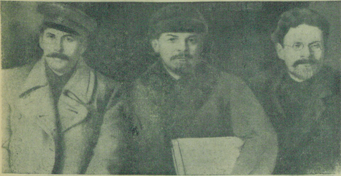
И. В. Сталин, В. И. Ленин и М. И. Калинин на 8-м съезде РКП(б) (март 1919 г.). Прессклише.