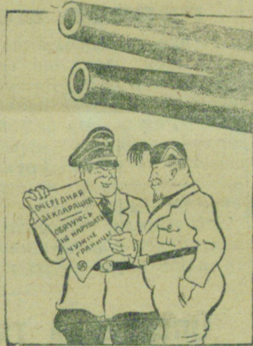
— Но кто же этому поверит? — Как кто? Наши мюнхенские коллеги. Рисунок В. Лисевича. Бюро-клише ТАСС.