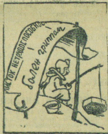
Симулянта — бюлетенщика с предприятия вон! Нашу страхаску обкрадывает он. (В. Маяковский). Рис. В. Анфилова. Бюро-клише ТАСС.