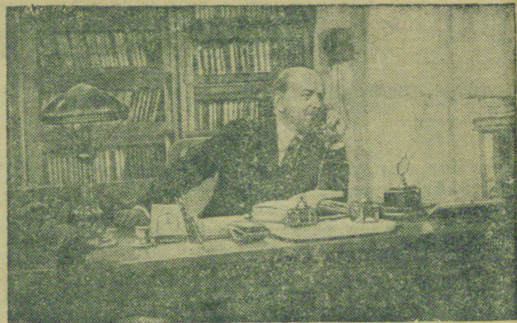
В киностудии „Мосфильм“ закончен производством художественный, историко-революционный фильм „Ленин“, являющийся продолжением фильма „Ленин в Октябре“. Режиссер фильма—В. Ромм. Роль В. И. Ленина исполняет народный артист СССР орденносец Б. В. Щукин.

На этом прерывается работа конференции. 26 февраля начались праздники.