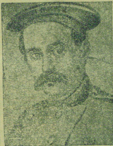
Репродукция с автопортрета Т. Г. Шевченко, нарисованного им в 1847 году во время пребывания в ссылке в Орской крепости.