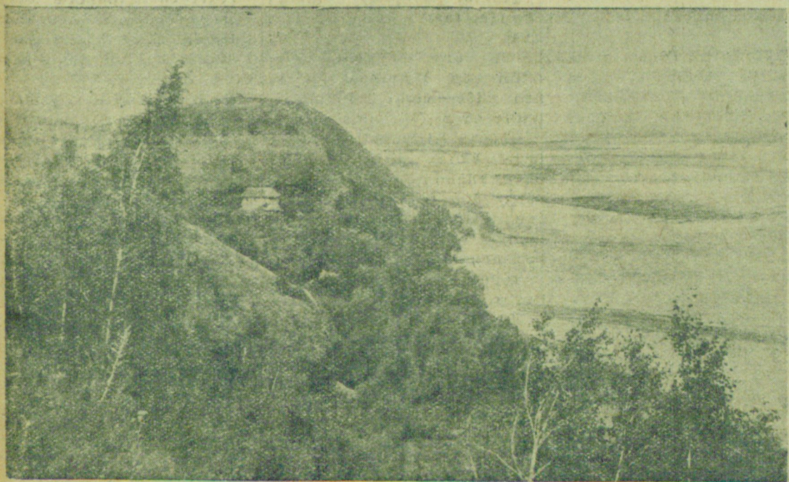
Могила Т. Г. Шевченко в Каневе на горе, над Днепром.