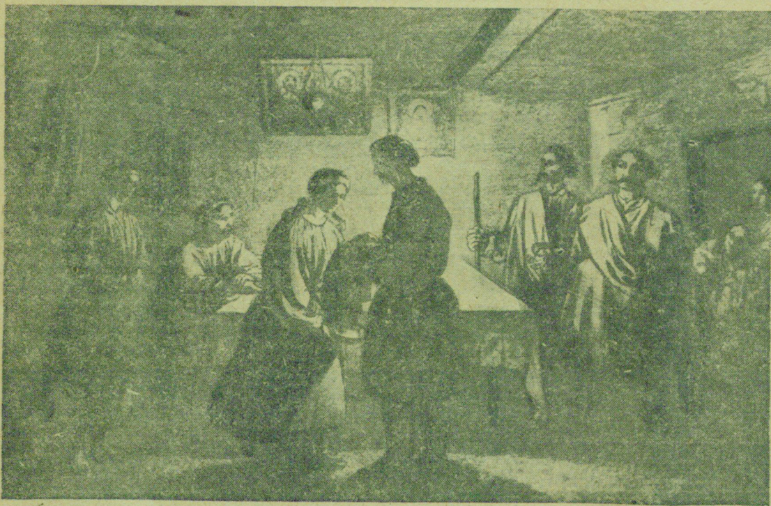
Картина Тараса Шевченко „Суд атамана“