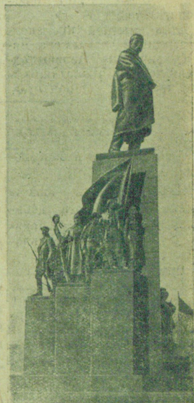
Памятник Тарасу Шевченко в Харькове. Памятник исполнен бригадой Ленинградских скульпторов по проекту заслуженных деятелей искусств Г. Манизера и И. Лангбарда.

Украинский народ и народы всего Советского Союза горячо любят своего великого поэта. Его песни и стихи выдерживают многочисленные издания. Великому Кобзарю в Харькове поставлен памятник.