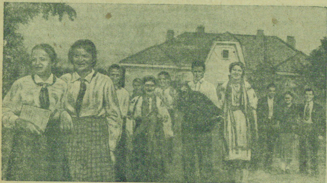
На родине великого писателя революционера Т. Г. Шевченко, (с. Шевченково, Ольшанский район, Киевская область). На снимке: молодежь села в выходной день.

По окончании деловой части, художественная самодеятельность Центрального клуба покажет свою работу — пьесу К. Тренева — „Любовь Яровая“.