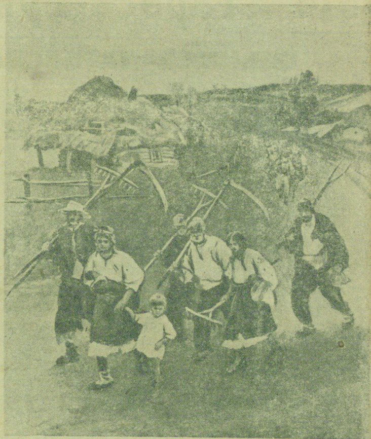
Иллюстрация художника Ижакевича „Нобзарю“ Т. Г. Шевченко.