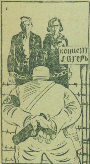
„Фашистское равноправие женщин и мужчин“. Рисунок Г. Вальк.