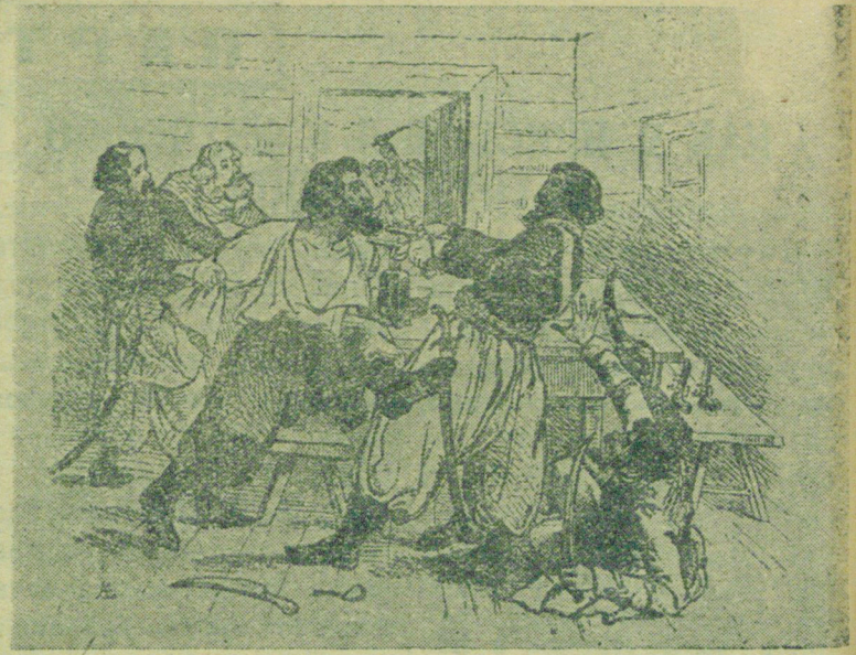
Рисунок Т. Г. Шевченко «АРЕСТ ПУГАЧЕВА»