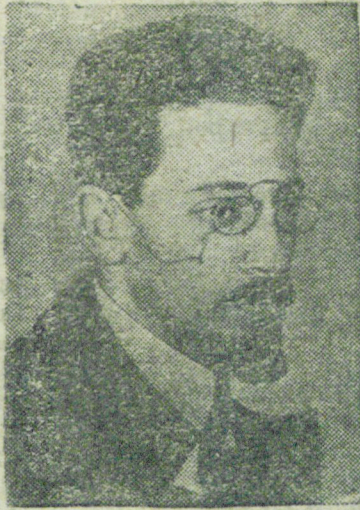
На снимке: Я. М. Свердлов.

Сейчас горняки шахты имени С. М. Кирова с большим подъемом изучают доклад великого Сталина. Х-й.