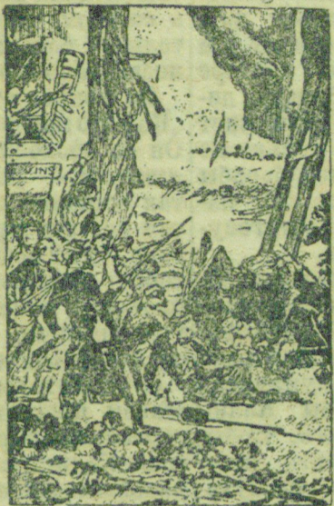
Баррикады Парижской Коммуны.

Парижская Коммуна просуществовала всего 72 дня. Французская и германская буржуазия объединилась для того, чтобы окружить революционный Париж кольцом своих войск и задушить Коммуну. Внутри