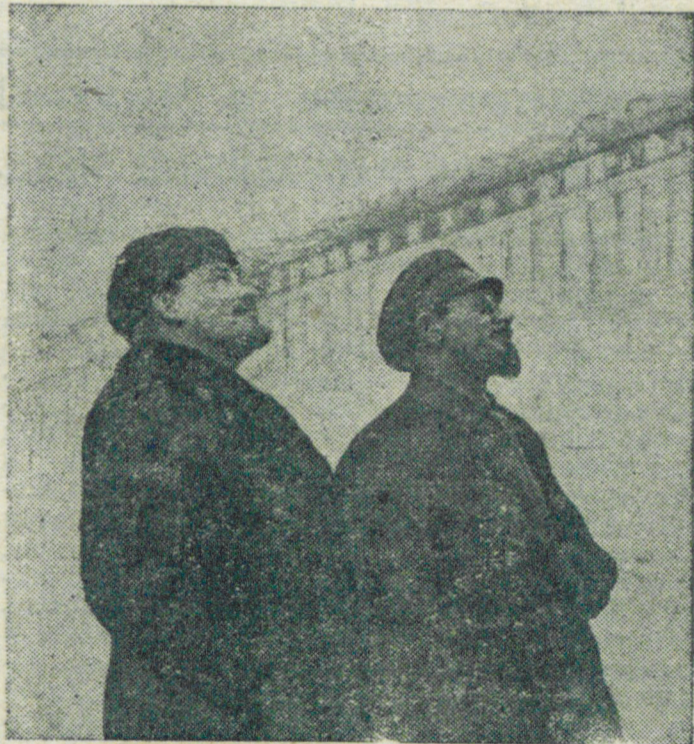
В. И. Ленин и Я. М. Свердлов на площади Революции в Москве (7 ноября 1918 г.)