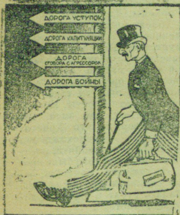
Путь Мюнхенских „миротворцев“. Рисунок Худ. Ю. Гальперина. Бюро-клише ТАСС.

В Х О Д С В О Б О Д Н Ы Й. РК ВКП(б), Партком Сланцев.