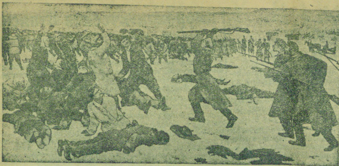
17 апреля исполнялась 27 годовщина со дня расстрела царскими войсками рабочих Ленских золотых приисков „Лензолото“ (1912 г.).

На снимке: картина заслуженного деятеля искусств К. Ф. Юона „На Лене после расстрела“. (Бюро клише ТАСС).