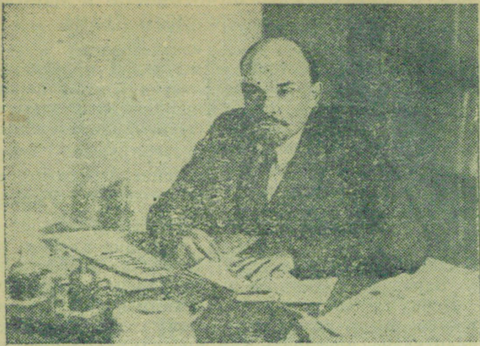
В. И. Ленин (1918 г.)