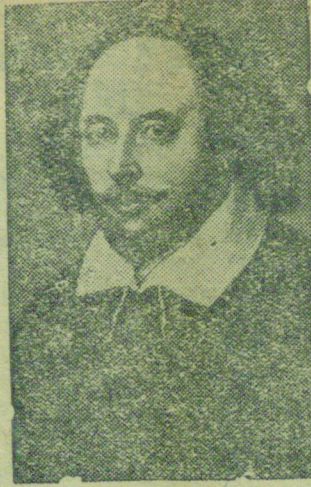
23-го апреля с. г. исполняется 375 лет со дня рождения английского драматурга Вильяма Шекспира. На снимке: Вильям Шекспир. (Бюро клише ТАСС).