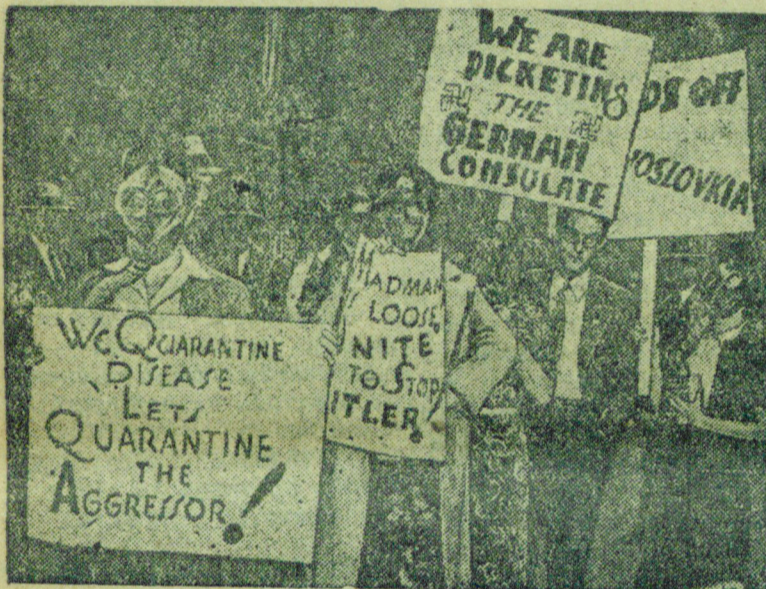
В Филадельфии (США) состоялась антифашистская демонстрация протеста против агрессивных действий фашистской Германии. На снимке: демонстрация у здания германского консульства.

Совнарком СССР постановил отметить серьезные успехи инженера-конструктора тов. Яковлева А. С. в деле конструирования новых типов самолетов и премировать его 100 тысячами рублей и автомашиной „Зис-101“.