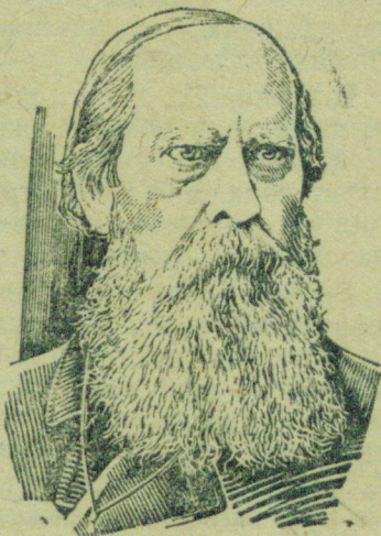
М. Е. Салтыков-Щедрин.

АБОРИГЕН (латинск.) — коренной житель какой-либо страны.