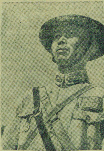
На снимке: Младший командир китайской армии.