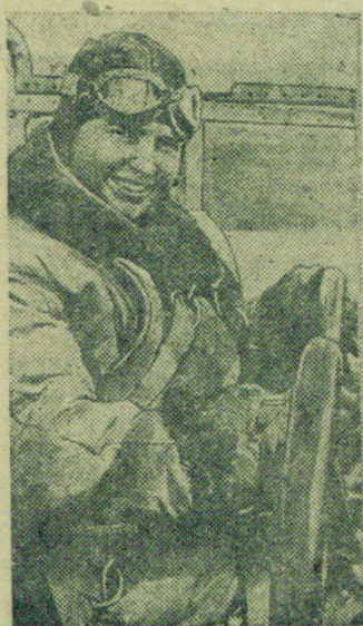
На снимке: Майор-орденоносец Полина Денисовна Осипенко, в кабине самолета. Снимок 1938 г.