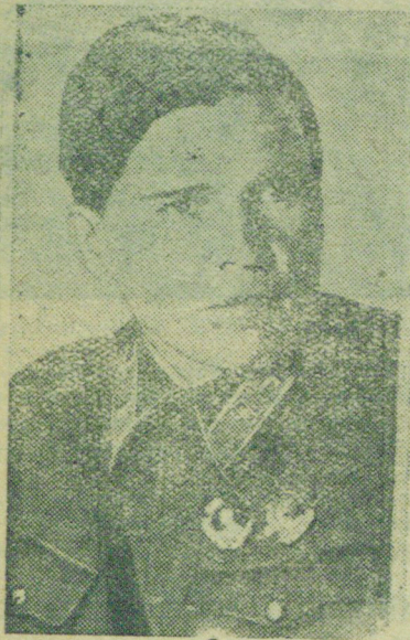
П. Д. ОСИПЕНКО.

На боевом посту, у штурвала воздушного корабля, погибли Полина Осипенко и Анатолий Серов — отважные дочь и сын великого советского народа, гордые соколы сталинской авиации, большевики, беспредельно преданные своей родине и коммунистической партии. Огромна утрата трудящихся Советского Союза, партии Ленина-Сталина, огромна утрата Красной Армии, потерявших двух лучших своих командиров, Героев Советского Союза.