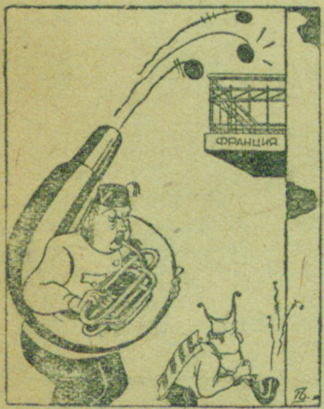
Нечто, непохожее на серенаду. Рисовал Г. Ведарева.