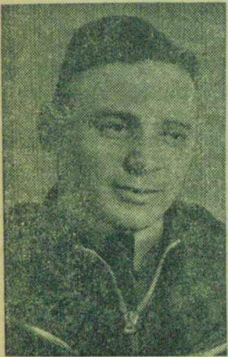
В. К. КОККИНАКИ.