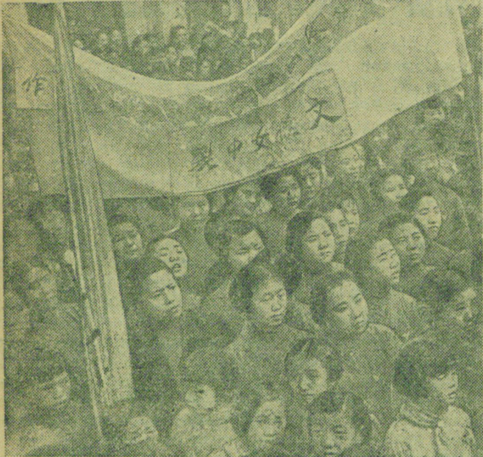
На снимке: массовый митинг китайских женщин в Чунцине (Китай). Бюро-клише ТАСС.