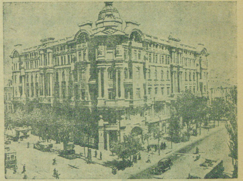
На снимке: на пересечении улицы Энгельса и Ворошиловского проспекта в Ростове-на-Дону.