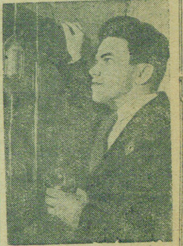
В Резолюции XVIII съезда ВКП(б) по докладу тов. Молотова о третьем пятилетнем плане развития народного хозяйства СССР предусматривается увеличение добычи газа из нефтяных и чисто газовых месторождений в 3,5 раза.