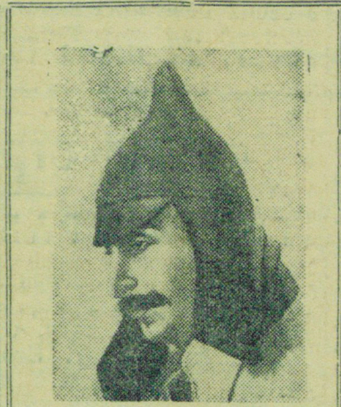
На снимке: Товарищ И. В. Сталин, организатор и руководитель обороны Красного Петрограда, летом 1919 года. (По материалам Музея Революции в Ленинграде).

„На фронте начались изменения. Несколько наших полков перешло на сторону