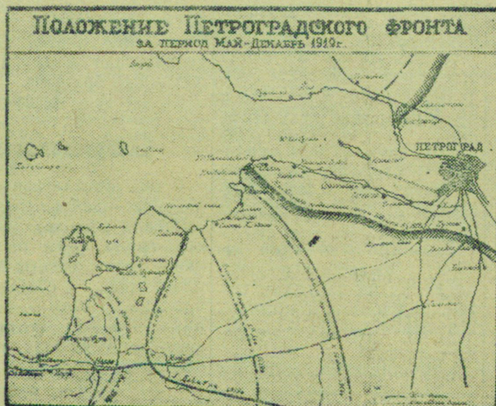
Схематическая карта положения Петроградского фронта за период май — декабрь 1919 года.