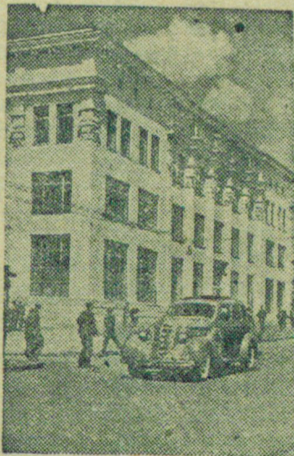
По городам Советского Союза.

3 июля бригаду перевели на подготовительные работы по освещению нижнего этажа железнодорожного бункера для сланца. Бригада, закрепив темпы первых двух дней июля, на два часа раньше срока окончила задание.