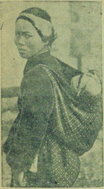
К военным действиям в Китае. На снимке: женщина с ребенком, оставшаяся без крова после бомбардировки японскими захватчиками ее родного города.