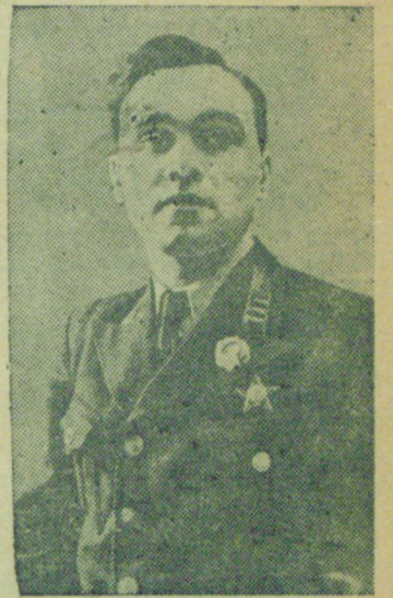
Конструктор — военный инженер 1-го ранга Александр Сергеевич Яковлев за выдающиеся заслуги в деле создания новых высококачественных конструкций самолетов награжден Президиумом Верховного Совета СССР орденом Ленина. Кроме того, Совларком СССР премировал тов. Яковлева выдчей 100 тысяч рублей и автомашиной „ЗИС“.

Монголо-советские войска отразили все атаки японо-манчжурских войск в районе Номон-Кан-Бурд-Обо и нанесли им большие потери. К северо-западу от этого района японская пехота, при поддержке не менее 60 танков, потеснила кавалерийские части монголо-советских войск и переправилась на западный берег р. Халхын Гол, заняв небольшой плацдарм. В результате решительной контр-атаки советско-монгольских войск и авиации, японские войска, переправившись на западный берег р. Халхын Гол, к исходу 5 июля с большими для них потерями отброшены к востоку от реки Халхын Гол. За эти дни расстреляно советско-монгольской артиллерией 50 японских танков, подбито восемь орудий. Убитых японо-манчжур — около 800 человек. Па-