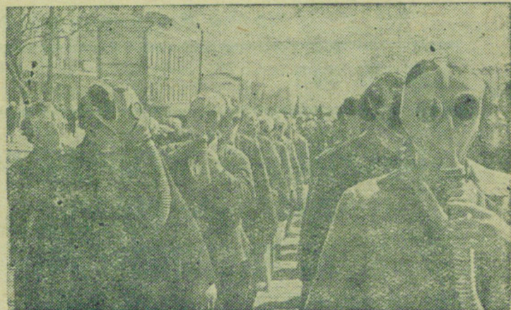
Молодежь города Мариуполя провела массовый поход в про- тивогазах.

(Из речи тов. К. Е. Ворошилова на XVIII съезде ВКП(б).)