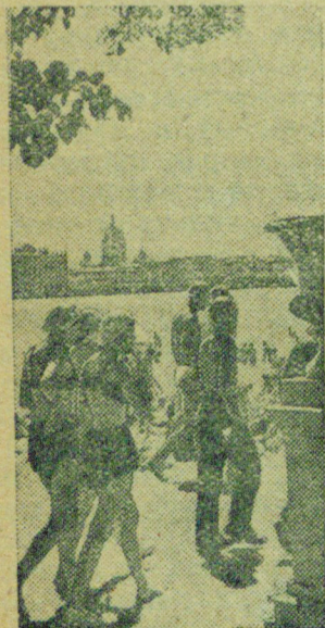
На пляже.