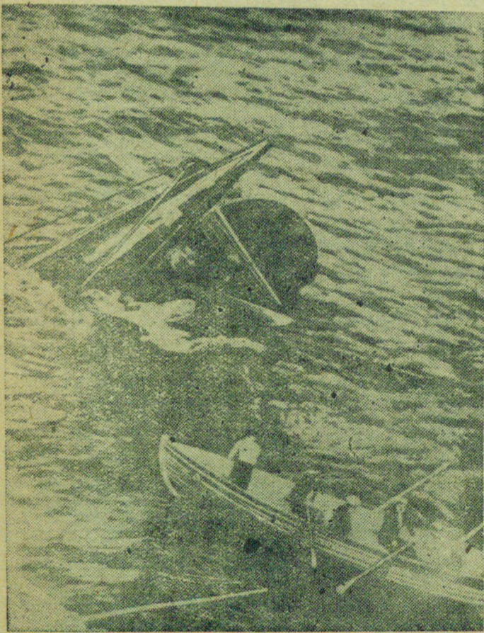
В Ливерпульском заливе затонула английская подводная лодка „Татис“. В лодке находился 101 человек.