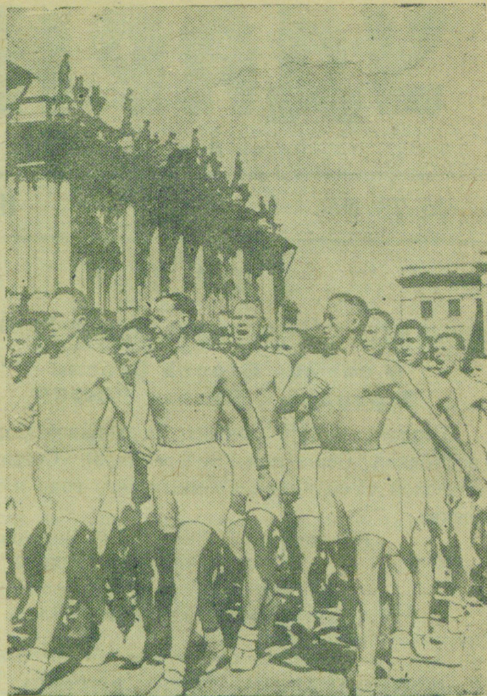
Физкультурный парад в Ленинграде.

На снимке: В колонне физкультурников Рабоче - Крестьянской Красной Армии.