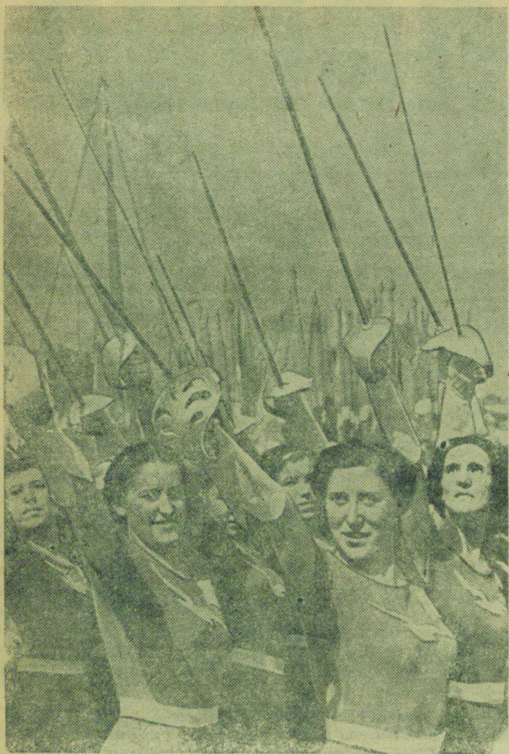
Физкультурники спортивного общества „Буревестник“ на физкультурном параде.