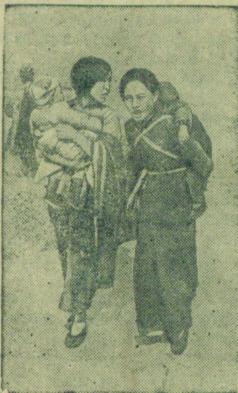
К военным действиям в Китае. Японские захватчики продолжают варварские бомбардировки мирных китайских городов и селений.

По мере того, как японские войска продвигались в глубь Китая, им приходилось растягивать свои силы. Враждебное отношение китайского населения и действия партизанских отрядов заставляют оккупантов держать крупные силы в занятых городах, а также, вдоль железнодорожных линий и судоходных рек. Японская армия распяляет свои силы, а ее военная техника, сосредоточенная на большой территории, уже не является для Китая такой угрозой, как прежде.