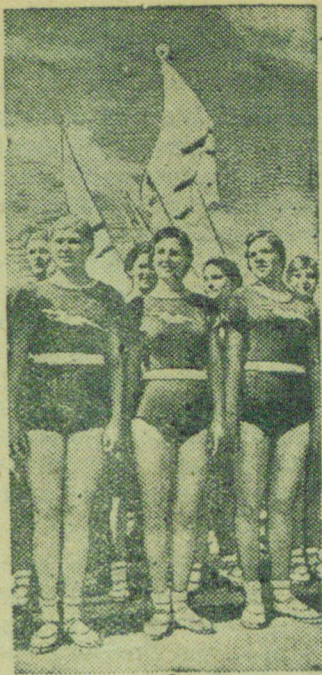
Физкультурный парад в Ленинграде.

Парижский корреспондент газеты „Дейли экспресс“ узнал из ответственных кругов, что в настоящее время расследуются дела по крайней мере 150 лиц, подозреваемых в содействии германской пропаганде.