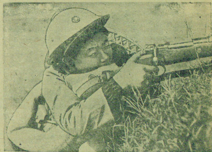
К военным действиям в Китае.

На снимке: Девушка-курсант военной школы на тактических занятиях.