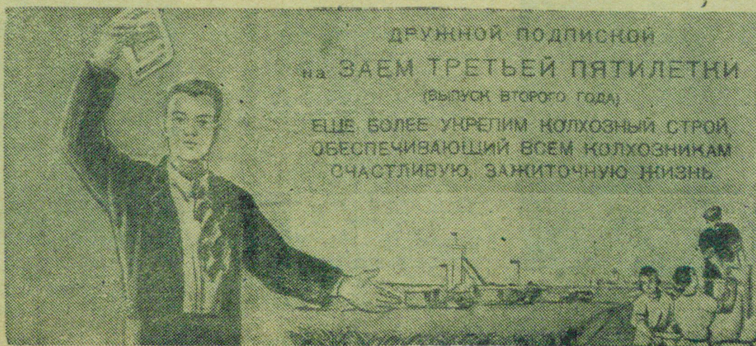
Плакат художника В. Леонова.