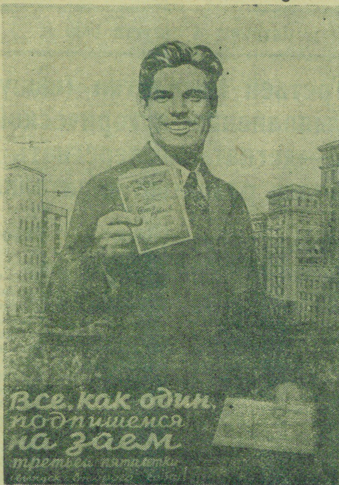
Плакат художника В. Корецкого. (Бюро-клише ТАСС).