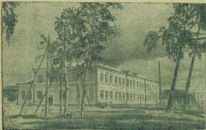
Строительство новых школ Ленинградской области. На снимке: Новая школа в г. Боровичи.

Дадим социалистическому государству новые средства, подпишемся на Заем Третьей Пятилетки (выпуск второго года)!