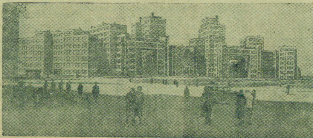
На снимке: площадь Дзержинского в Харькове.

Подпиской на новый заем советский народ еще раз докажет свою готовность сделать все для выполнения грандиозной задачи нашего времени — догнать и перегнать главные капиталистические страны в экономическом отношении — и тем самым сделать СССР самой передовой и счастливой страной в мире.