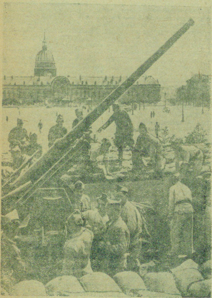
Подготовка к обороне Франции.

На снимке: демонстрация населению Парижа действия зенитной артиллерии.