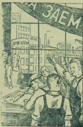
— Наши займы поистине беспронгрышны!