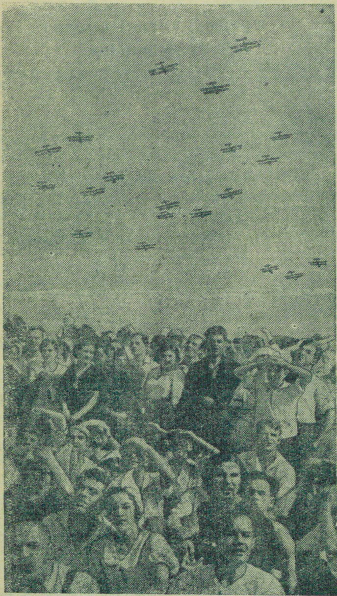
18 августа в Ленинграде на аэродроме Авиагородка состоялся большой народный праздник, посвященный Дню авиации.

На снимке: трудящиеся наблюдают за полетами.