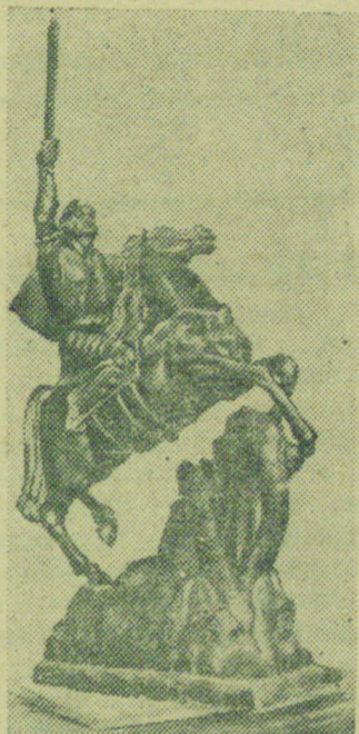
К 1000-летию юбилею „Давида Сасунского“.

Вторая часть посвящена героической деятельности сына Санасара — Мгера-старшего. Сызмальства Мгер готовился к защите родины, все дни проводил на охоте, приобретая боевые навыки и добывая пищу для сасунцев. Юный Мгер убивает чудовищного льва, закрывшего дороги, по которым