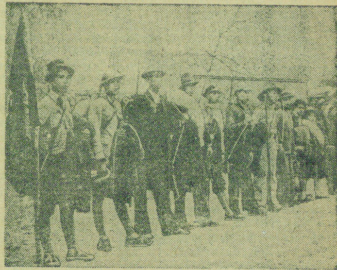
На снимке: партизанский отряд в провинции Гуандун перед отправкой на фронт.

Газета „Саотанбао“ пишет, что во время бомбардировки аэродрома был ранен командующий японскими силами в Китае генерал Нисио. (ТАСС)