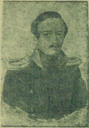
М. Ю. Лермонтов.

К 125-летию со дня рождения (15 октября 1814 г.) великого русского поэта Михаила Юрьевича Лермонтова.