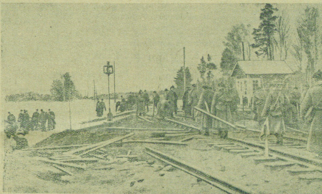
На снимке: Восстановление железнодорожных путей, взорванных финляндской военщиной при отступлении.

На ряду с насильственной эвакуацией министерство внутренних дел Финляндии организовало чрезвычайный надзор за населением Финляндии. Полиция запрещает гражданам даже выходить на улицы“.