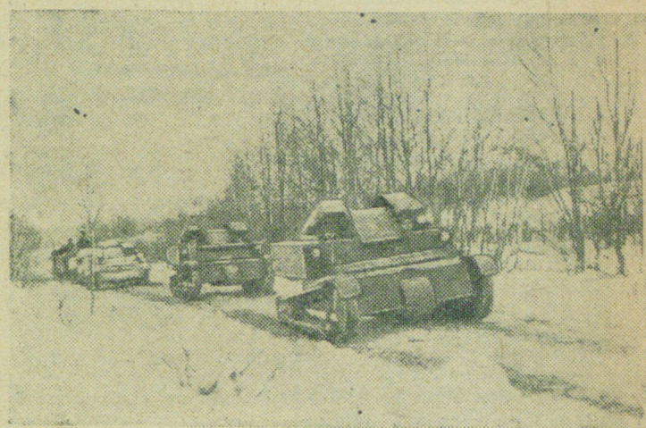
На снимке: Мехчасти совершают марш на финской территории.

В следствие плохой погоды боевых действий авиации не было.