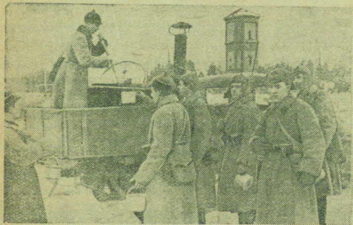
На снимке: Во время привала на финской территории. Бойцы Красной Армии получают обед из полевой кухни.