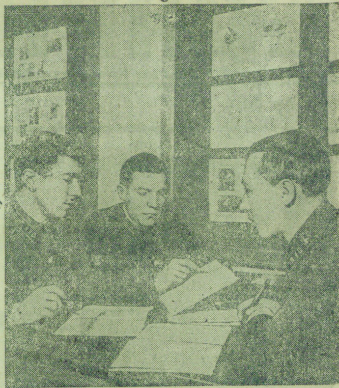
В Ленинградском Военном училище связи для занятий по истории ВКП(б) организован кабинет, снабженный вспомогательными материалами.