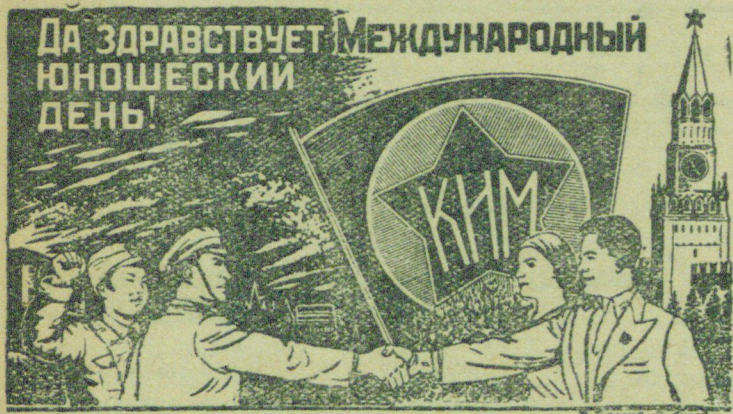
Рисунок В. Баркова и В. Лисевича.