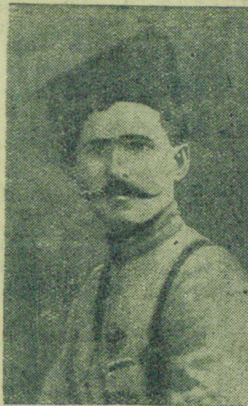
Легендарный герой гражданской войны В. И. Чапаев.

(5 сентября исполнилось 20 лет со дня героической гибели В. И. ЧАПАЕВА)